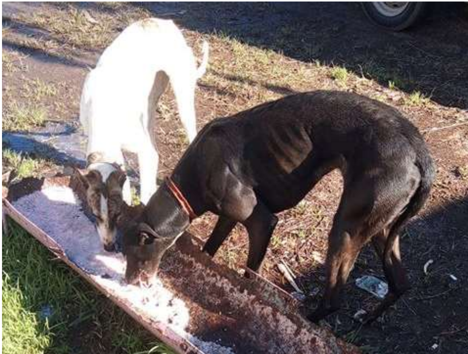
Foto: Grupo Perros d caza perdidos encontrados Uruguay (Facebook), fecha 06/07/2020, el dueño busca su perra (la negra). Véase la delgadez del animal y el alimento que se les da: arroz blanco solo.

https://www.facebook.com/photo.php?fbid=302215750951938&set=pcb.3123735124379604&type=3&theater&ifg=1