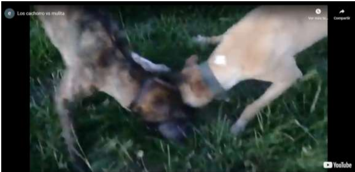
Fragmento de video, dos perros matando una mulita siendo filmados por el cazador. https://youtu.be/7GpeOQcfu-g