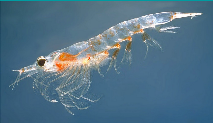
Krill ( Euphausia superba )

alimentarse de fitoplancton, estas migraciones son realizadas diariamente por una cantidad enorme de organismos. El krill es uno de los más conocidos dentro del zooplancton, ellos son el principal alimento de las ballenas.