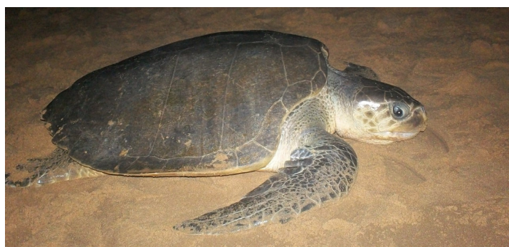
Tortuga olivácea Lepidochelys olivacea

Las tortugas verde, siete quillas y cabezona son las tres especies más comunes en Uruguay, mientras que la carey y la olivácea se observan con menor frecuencia. Estas especies llegan a nuestras aguas para alimentarse, ninguna de ellas se reproduce aquí, ni anida en nuestras playas. Se alimentan de medusas, algas, moluscos, crustáceos, peces, corales y esponjas; la dieta es específica según la especie. Mientras la tortuga verde se alimenta de algas, las medusas son la base de alimentación de la tortuga siete quillas.