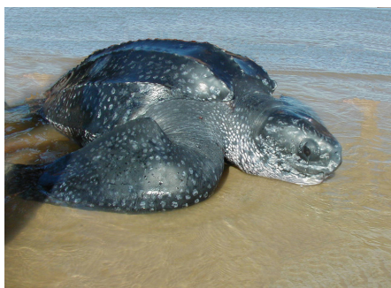
Tortuga siete quillas o laúd Dermochelys coriacea

Habitan mares tropicales y subtropicales de todo el planeta, prefiriendo aguas cálidas con temperaturas superiores a los 20°C. Presentes en todos los continentes excepto la Antártida.