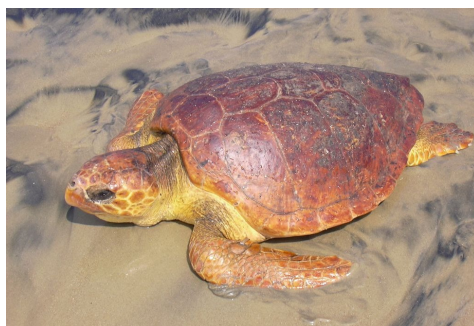
Tortuga cabezona Caretta caretta