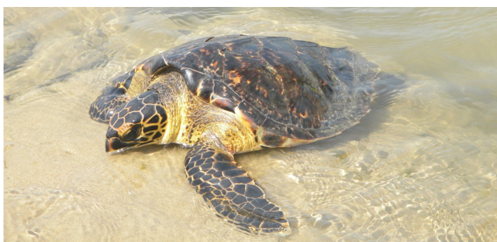
Tortuga carey Eretmochelys imbricata