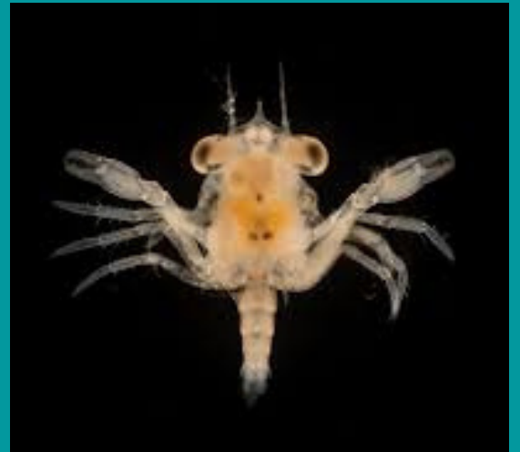
larva de cangrejo

El plancton es importantísimo en el ecosistema oceánico y muy sensible a modificaciones en el medioambiente tales como temperatura, salinidad, pH y concentración de nutrientes. Algunos cambios asociados al cambio climático pueden producir alteraciones en el tipo y abundancia de fitoplancton, que a su vez influye en el zooplancton que se alimenta de él y que a su vez afectará a otras especies a lo largo de la cadena trófica.