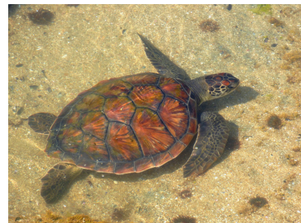
Tortuga verde Chelonia mydas