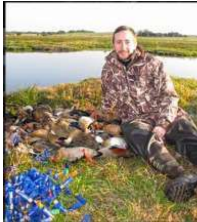
En la foto se ven varios Patos Brasileños (Amazonetta brasiliensis)